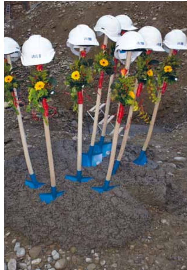
Kurz bevor die hermetisch versiegelte Kupferkiste unter dem Jazz Campus einbetoniert wird.