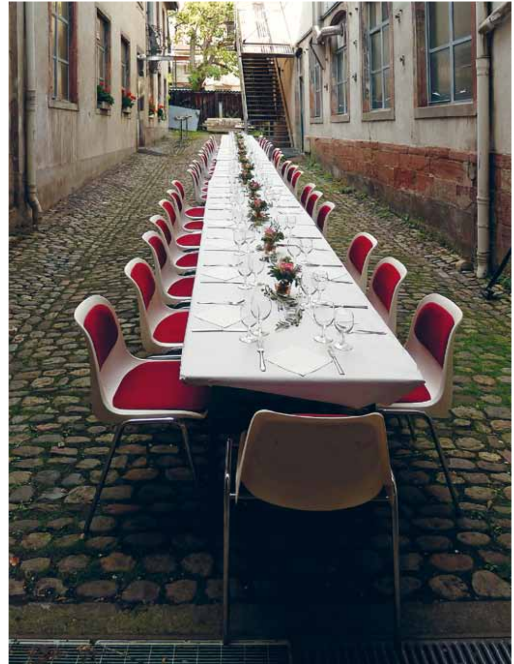
Für die Jubiläumsfeier festlich gedeckter Tisch im Innenhof der Rheingasse 31/33.