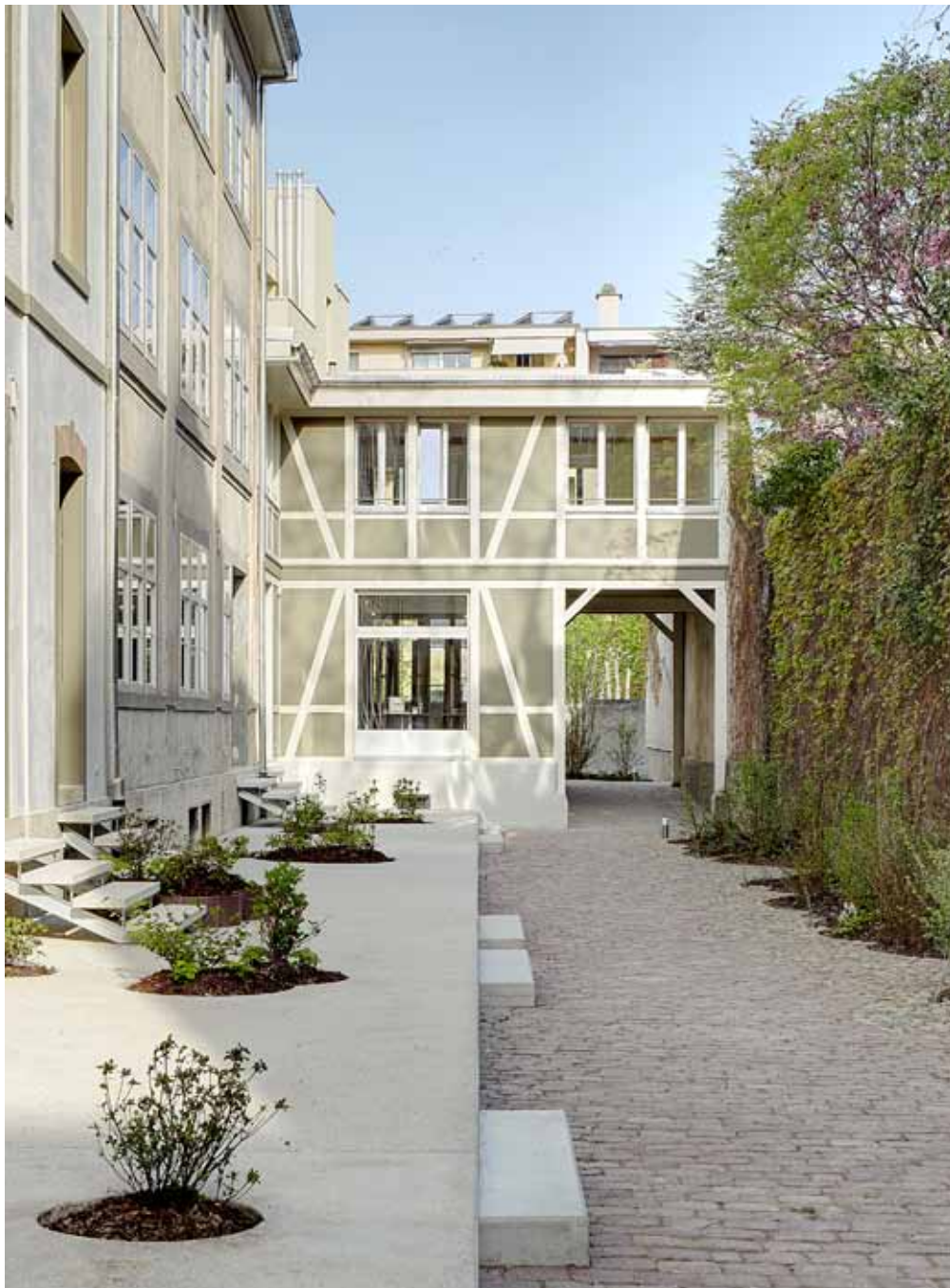
Die sorgfältig gestalteten Umgebungsarbeiten begeistern die MieterInnen.