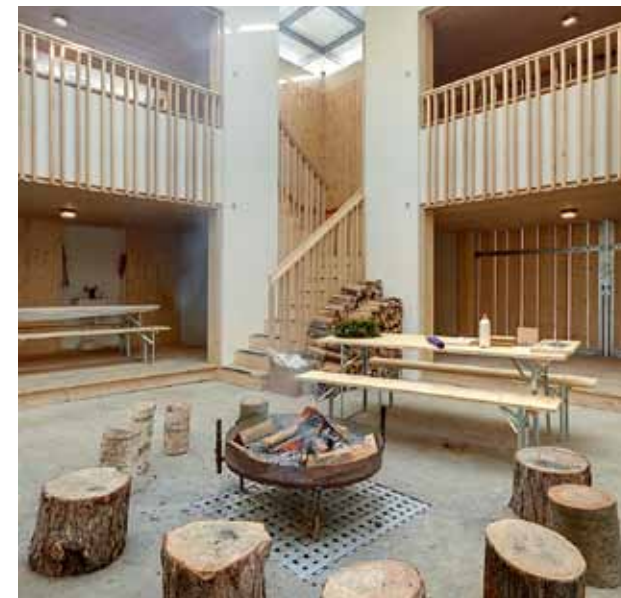
Gleichzeitig drinnen und draussen: In der Spielhalle geht das.

Meine guten Gäste mögen mir treu bleiben!