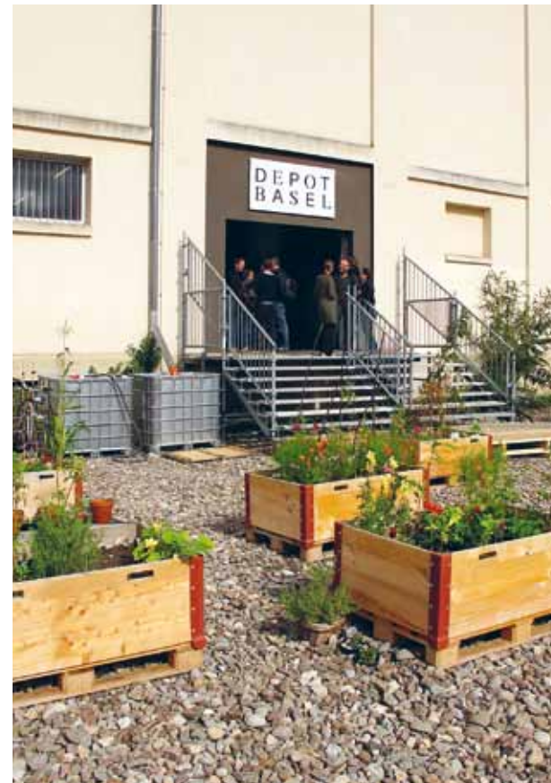
Depot Basel: «Wir sind keine Messe. Wir sind kein Festival, kein Museum, kein Showroom, keine Galerie. Wir sind ein temporärer Ort für kontemporäre Gestaltung, mit den besten Absichten.»

Den Diskurs, den Dialog und das Bewusstsein von Gestaltung und Alltag zwischen heute, gestern und der Zukunft zu suchen, ist mein Anliegen. Die Silotrichter, die das Wesentliche, das Essenzielle konzentrieren und auf den Punkt bringen, sind für mich Sinnbild dafür.